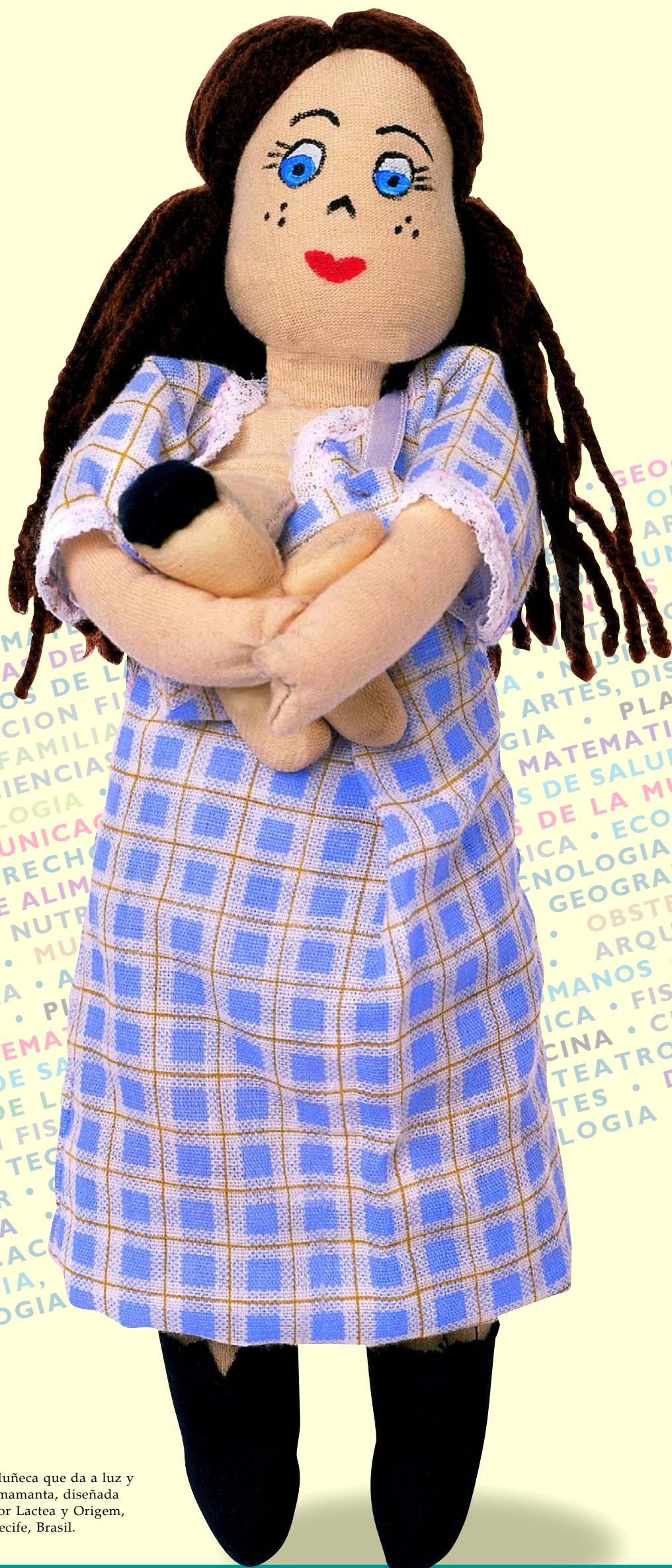
Muñeca que da a luz y amamanta, diseñada por Lactea y Origem, Recife, Brasil.